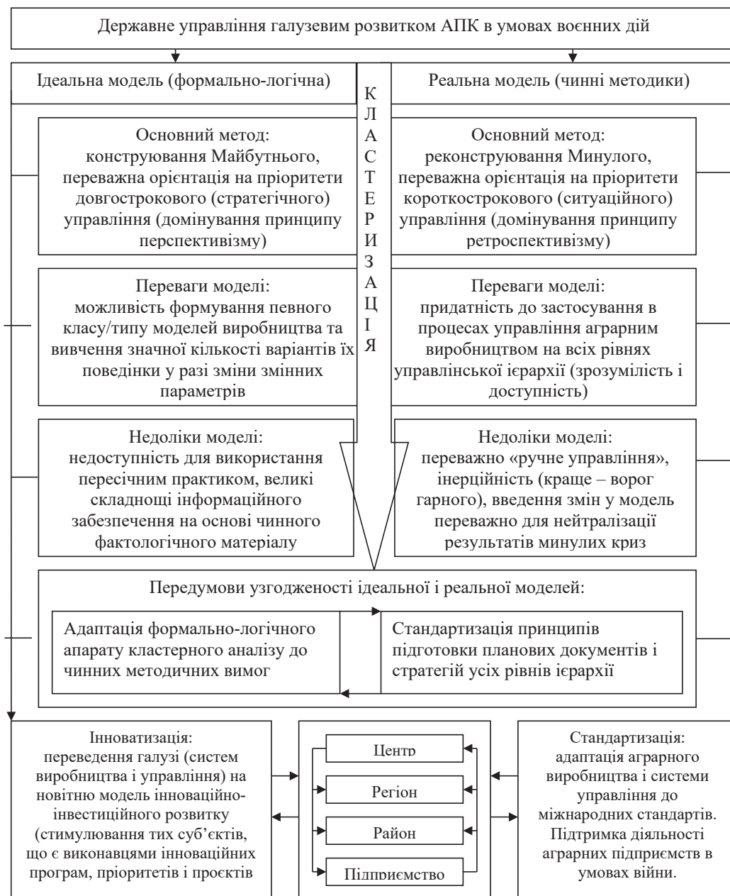
Рис. 1. Схема поєднання ідеальної і реальної моделей державного управління розвитком аграрного сектору економіки в умовах воєнного стану

чином, окрім ядра кластера у вигляді новоствореного Відділу регіональної продовольчої безпеки, в основі кластера повинна міститись науково-дослідна установа, здатна забезпечити прогресивний розвиток кластерного утворення на основі сучасних технологій та ідеологій модернізації.