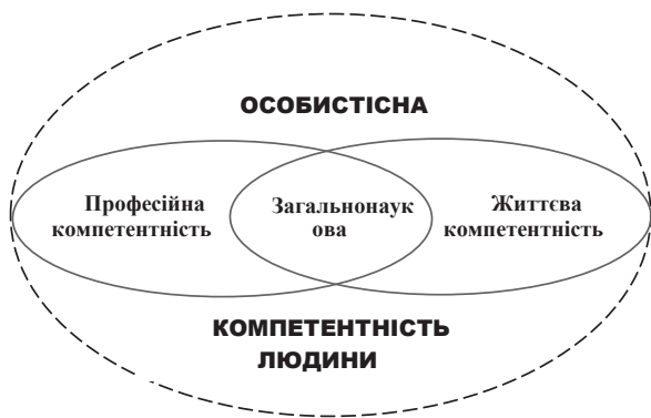
Рис. 1. Місце загальнонаукової компетентності у структурі особистісної компетентності

Загальнонаукова компетентність забезпечує розвиток критичного мислення, уміння здійснювати аналіз і синтез, розуміння проблем та вибір інструментарію їх вирішення, а також здатність орієнтуватись у проблемах і тенденціях сучасного світу з його різноманітними науковими знаннями і технологіями. Загальнонаукова компетентність важлива не лише для забезпечення успішної освітньої діяльності, а й для подальшого професійного розвитку та формування цілісної життєвої позиції. Вона допомагає людині адаптуватися до змін у суспільстві та до швидкого розвитку наукових і технологічних досягнень. Володіння загальнонауковою компетентністю сприяє формуванню глибшого розуміння світу.