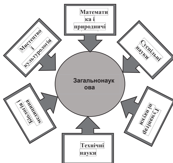
Рис. 2. Сукупність наук, що формують загальнонаукову компетентність

Математика і природничі науки: математика, фізика, хімія, природознавство тощо. Вивчення цих наук допомагає розвивати аналітичні та логічні мисленнєві навички, а також розуміння основних принципів і законів природи.