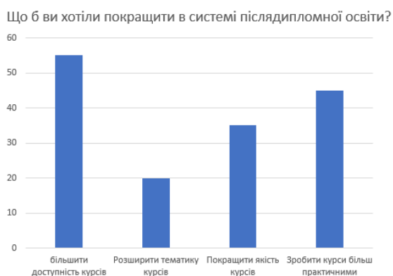
Рис. 3. Відповіді респондентів

Із деяких пір помітної значимості набуває проблема підвищення якості системи післядипломної освіти. На відкрите запитання: «Що б ви хотіли покращити в системі післядипломної освіти?» респонденти відзначили збільшення доступності курсів (55,3%), зробити курси більш практично орієнтованими (48,7%), підвищити якість курсів (37,45%) та розширити тематики курсів (20%). Ще додатково були такі відповіді: