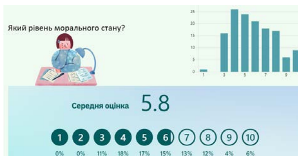
Рис. 3. Відповіді респондентів за шкалою 2

Відповідно до отриманих даних, середній показник шкали 1 «Рівень напруги/стресу» становить 6,4 бали (середній рівень), що свідчить про підвищений рівень напруги респондентів, проте він не досягає екстремального значення. Проте відомо, що на стрес організм людини відповідає неспецифічною стресовою реакцією, що несе загрозу фізичному (підвищення тиску, збільшення частоти серцевих скорочень, порушення роботи шлунково-кишкового тракту, пригнічення імунної системи) та психічному (порушення якості мислення, уваги, запам'ятовування) здоров'ю людини. Як наслідок, знижується інтелектуальна працездатність, зростають психічна втомлюваність та виснаженість.