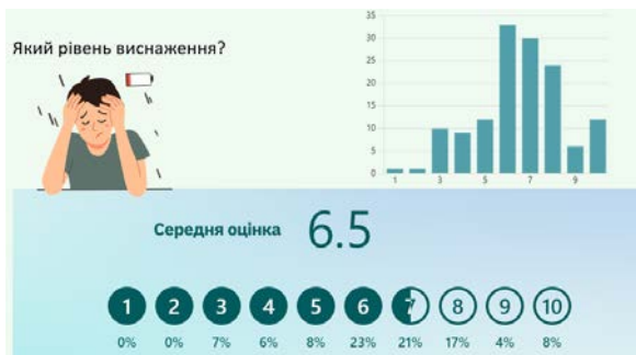
Рис. 4. Відповіді респондентів за шкалою 3

бистісних якостей. Саме моральний стан є інтегральним показником, який визначає готовність до діяльності.