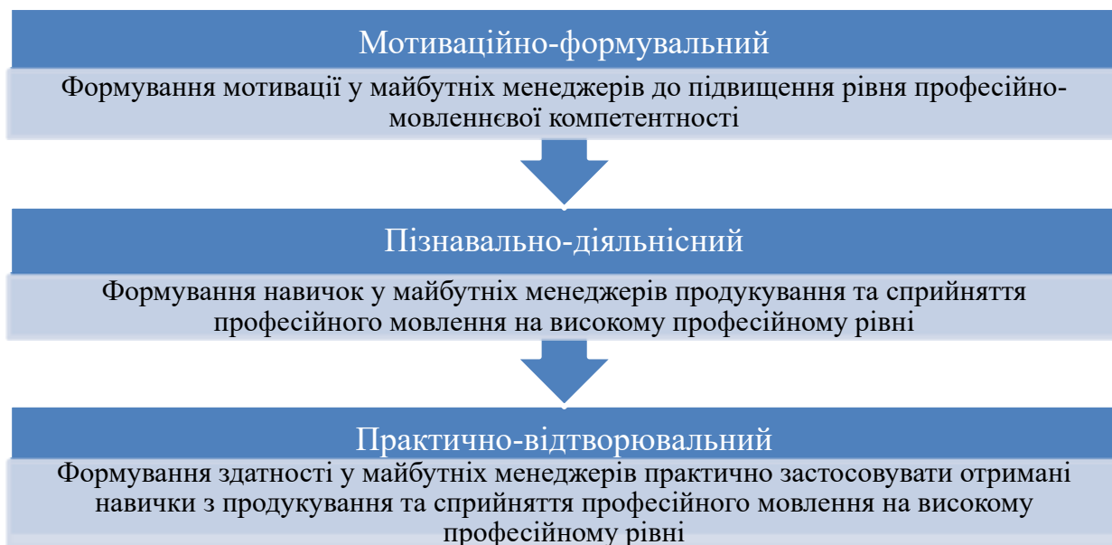
Рис. 2. Етапи формуально-розвивальної стадії формування професійно-мовленнєвої компетентності майбутніх менеджерів

Вважаємо основним завданням формуального психологічного комплексу мотиваційних установок перетворення майбутнім менеджером зовнішньої мотивації на внутрішню.