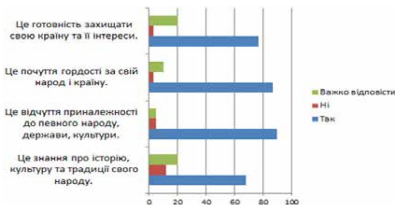
Рис. 1. Відповіді респондентів

Особливо важливим є формування національної ідентичності в умовах сучасної України, яка переживає складний воєнний період. Важливо, щоб молоді люди розуміли українську історію, культуру та традиції, а також усвідомлювали свою роль у захисті країни та